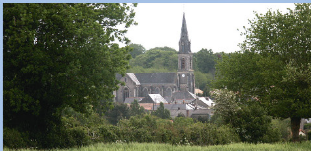
Vue de Sainte-Christine

Ce parcours est autorisé aux VTT, à l'exception des accès à la grotte et à la chapelle.